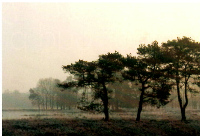
B&B Inn The Woods ligt midden in het Amerongse Bos; je loopt hier zo de uitgestrekte bossen in, afgewisseld met heidevelden.